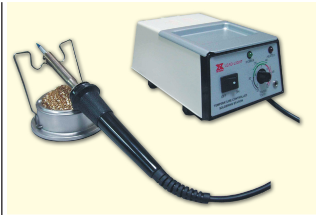
Рис. 3. Паяльная станция LT-80