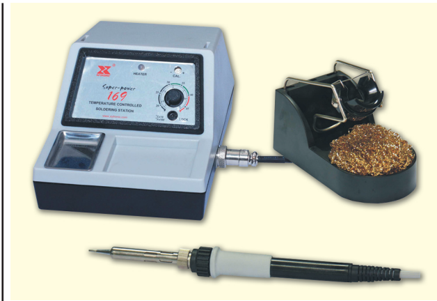
Рис. 2. Аналоговая паяльная станция SUPERPOWER 169